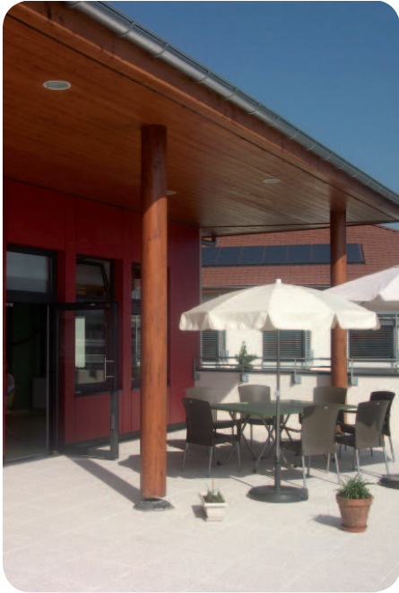
Une terrasse abritée permet de profiter des beaux jours

Depuis le 7 juin 2011, « Fleur de coton » accueille des personnes âgées atteintes de la maladie d'Alzheimer ou apparentées vivant à domicile.