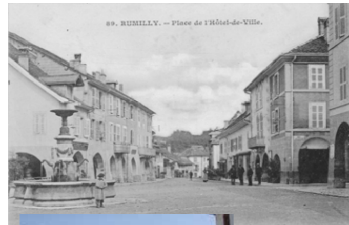
Place de l'Hôtel de Ville : Autrefois Place du Bourg, cette place s'étire dans un profil de « place-rue ».