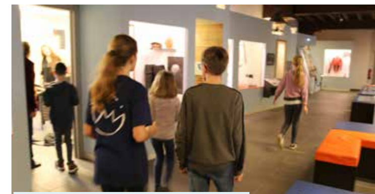
Escape game au musée, lors de la Semaine de la Jeunesse 2023