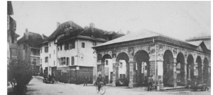
La place Grenette : Construite en 1822, elle est le symbole de richesse et de solidité du territoire. Rumilly fut connu pour être « le grenier au blé de la Savoie ».