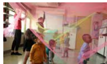
La compagnie Kay en immersion à la crèche Croqu'Lune de Rumilly, avril 2023

La compagnie Kay est allée à la rencontre des tout-petits, à la crèche Croqu'Lune de Rumilly, durant l'année 2023, pour réaliser des ateliers de danse. La prouesse ici est de réussir à embarquer des enfants hauts comme trois pommes, et de les faire danser tous ensemble ! Alors depuis septembre 2024 et jusqu'à avril 2025, la compagnie Kay s'invite également dans plusieurs classes de maternelles de Rumilly, toujours pour transmettre l'énergie communicative de la