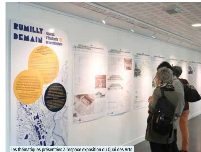
Les thématiques présentées à l'espace exposition du Quai des Arts sont très variées, mettant à l'honneur plusieurs disciplines

Des fourmis dans les mains Chanson - 20h30