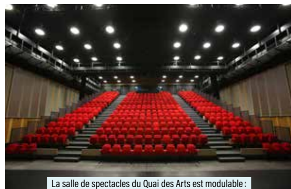
La salle de spectacles du Quai des Arts est modulable : 400 places assises OU 750 places debout