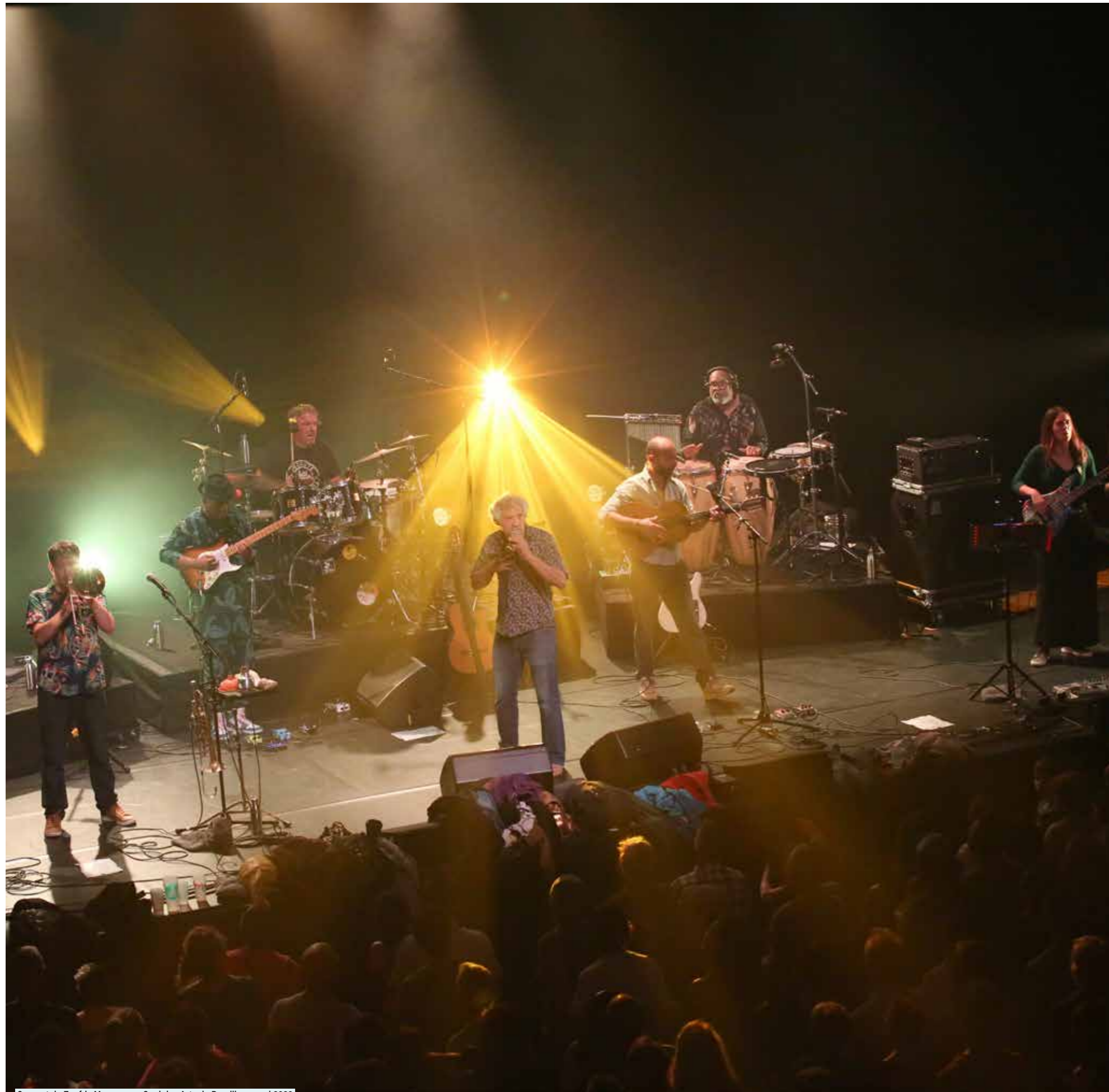
Concert de Zoufris Maracas au Quai des Arts de Rumilly en mai 2023