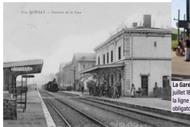
La Gare : Les travaux de la voie ferrée débutent en juillet 1862 et s'achèvent en mai 1865. Le 5 juillet 1866, la ligne est ouverte au trafic régulier. Tout transit est obligatoirement par la gare jusqu'en 1920.