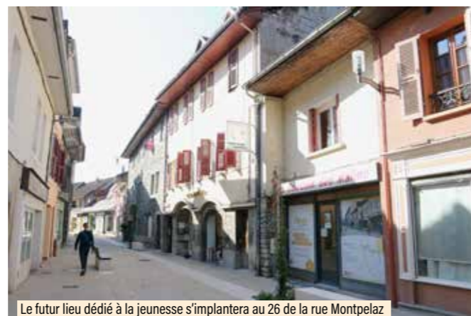
Le futur lieu dédié à la jeunesse s'implantera au 26 de la rue Montpelaz (enseigne Le bon coin des malins )

Le but est d'offrir aux collégiens et aux lycéens un espace pour se retrouver en dehors de l'école et accéder à des informations spécifiques, être accompagné dans leurs projets personnels et dans la création d'événements collectifs, le tout en coordination avec le service jeunesse de la Ville et ses nombreux partenaires. Les contours du fonctionnement de ce lieu sont actuellement