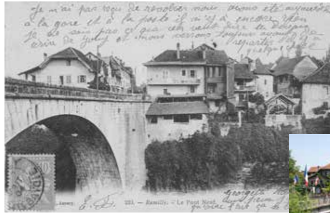
Le Pont Neuf : L'ancien Pont St Joseph est détruit le 29 juin 1940. Le pont, qui enjambe le Chéran, est remis en service en 1942.

Dans le cadre de l'exposition temporaire La Haute-Savoie pittoresque. Ernest et Auguste Pittier, éditeurs de cartes postales (voir agenda page 22), le musée vous propose une plongée au cœur du Rumilly du début du xx e siècle et des évolutions qu'ont connu les lieux familiers de notre quotidien en 100 ans !