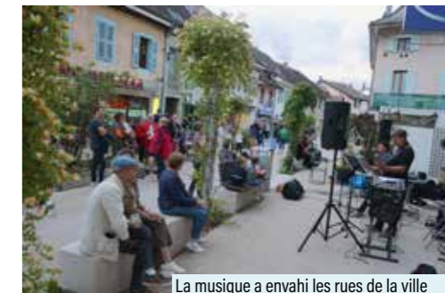
La musique a envahi les rues de la ville lors l'édition 2024 de la fête de la musique