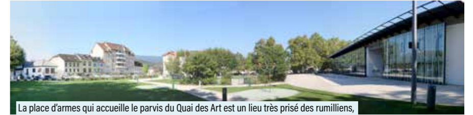
La place d'armes qui accueille le parvis du Quai des Art est un lieu très prisé des rumilliens, accueillant de nombreux événements