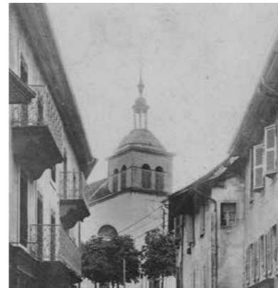
L'Église et la Grande Rue : L'Église Sainte Agathe possède des fondations médiévales. Reconstituée à plusieurs reprises (notamment à cause de plusieurs tremblements de terre) ses peintures murales et l'orgue sont classés au Patrimoine historique.