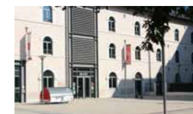
Musée Notre Histoire de Rumilly 5 place de la manufacture 74150 Rumilly

d'Ernest et Auguste Pittier, au tournant des XIX e et XX e siècles. Cette exposition réalisée en 2016 par les Archives départementales de la Haute-Savoie, est enrichie par les photographies et cartes postales issues des collections de Rumilly (voir l'agenda page 22).