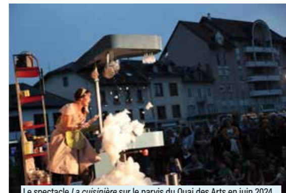
Le spectacle La cuisinière sur le parvis du Quai des Arts en juin 2024

Les élus, et donc l'adjoint en charge que je suis, ont le devoir d'orienter, de proposer, de se faire le relais des citoyens, et d'assurer la garantie d'une cohérence politique sur les choix artistiques, et ensuite de décider. Avec les services, nous façonnons, les principes et le cœur de la politique culturelle à suivre. Mais ce sont les professionnels de la