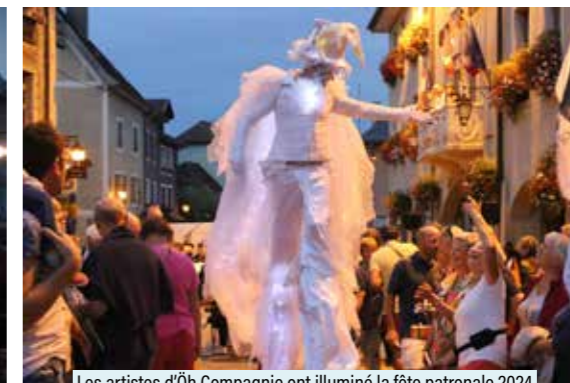
Les artistes d'Oh Compagnie ont illuminé la fête patronale 2024