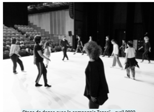
Stage de danse avec la compagnie Tensei - avril 2022